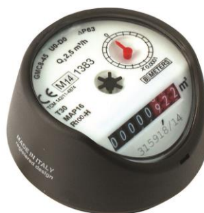
GMC8-45 med snedställt räkneverk