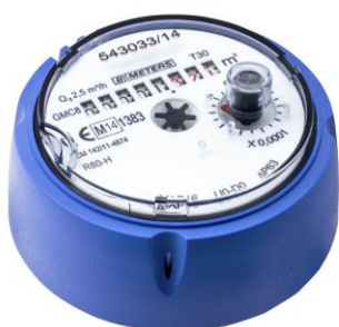
GMC8 med standardräkneverk

Fastighetsmätaren för kallvatten GMC8 är en vattenmätare väl lämpad att mäta små vattenförbrukningen i alltifrån lägenheter till enfamiljshus till mindre flerbostadshus och industrifastigheter. Väl beprövad konstruktion vilket garanterar lång livslängd och hög noggrannhet. Mätaren finns i DN15 med flödesområde Q 3 2,5 t.o.m. DN20 med flödesområde Q 3 4 m 3 /h. Mätaren är typgodkänd som debiteringsmätare MID R=100 eller som option R=160. Mätaren räkneverk är helt skilt från vattnet och är därmed helt skyddad från eventuell försmutsning. Mätaren GMC8-45 finns även med ett snedställt räkneverk för förenklad avläsning av mätarställningen.