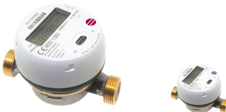
Varmvatten- och kallvattenmätare HYDRODIGIT med WM-buskommunikation