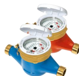
Passar mod GMDM-I & GMB-I